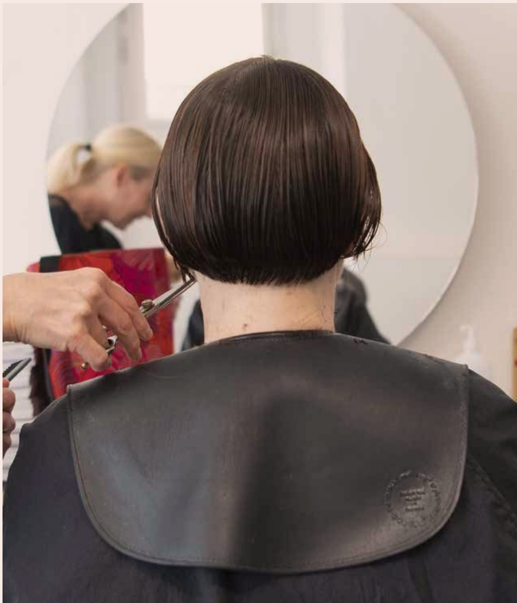
KLIPPT FÖR MÅNGA. Antalet frisörföretag minskade i fjol, mycket till följd av pandemirestriktioner. Slopade moms och slopade arbetsgivaravgifter hade räddat många, hävdar branschen.