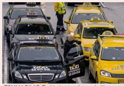
TOMMA BILAR. Taxi är ännu en bransch där många företag tvingats ge upp.