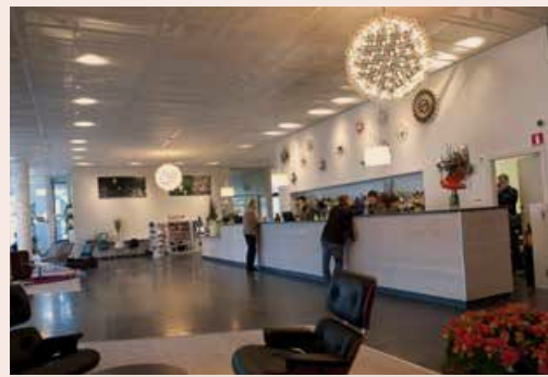
MÅNGA CHECKAR UT. Hotellbranschen har haft det omvittnat tufft.